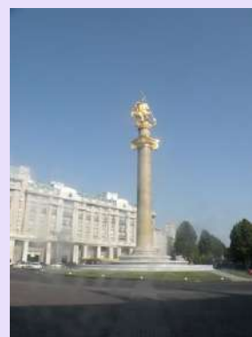
Tbilisi centralni trg