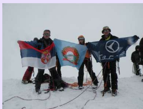
Na vrhu, Kazbeg(5033m)

Veoma je hladno da bi se više zadržavali. Zavijorila se državna zastava, zastava Pobede i našeg vernog pratilaca Laste. Odmorićemo se kad se skinemo sa ove nezgodne bele kupe. U silasku još veća opreznost. Nikome u navezi ne bi bilo prijatno da se neko oklizne. Mogli bi da biramo rusku ili gruzijsku stranu. Sve je bilo po planu. Sada nam nije bilo žao para za vodiča. Na prevoju se malo odmaramo pa nastavljamo dalje. Crni oblaci nas požuruju.