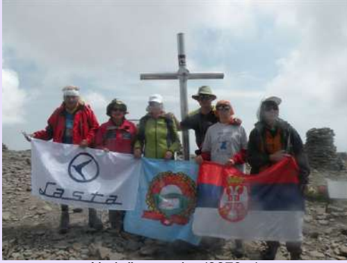
Na južnom vrhu (3879m)