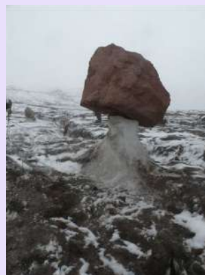
Kao đavolja varos

Posledice globalnog otoplavanja su očigledne. Dereze skinusmo tek na silasku sa glečera. Malo nam je laknulo. Jedva čekamo da dođemo u dom na tople i hladne napitke. Još jednu noć smo prespavali u domu. Verovatno smo prva grupa iz Srbije na Kazbeku. Sutradan smo krenuli istom stazom, ali sa manje tereta, od doma ka glečeru.