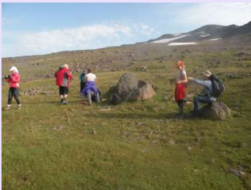
Pauza na usponu

Nismo se puno zadržavali na jezeru već smo odmah krenuli ka vrhu. Vreme je bilo sunčano, a vrh vidljiv. Normalno da staze nisu markirane ali se naslućuju.