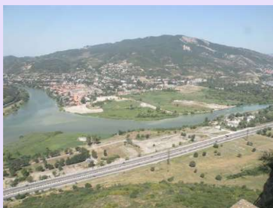
Usce Argave i Kure