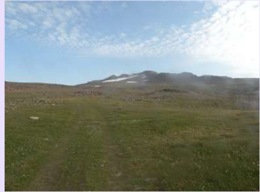
Ka južnom vrhu

Nismo se puno zadržavali na jezeru već smo odmah krenuli ka vrhu. Vreme je bilo sunčano, a vrh vidljiv. Normalno da staze nisu markirane ali se naslućuju.