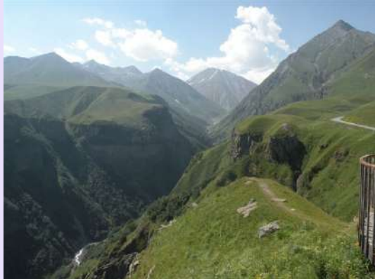
Na putu ka Kazbeku

Ovde su u nemirnim i opasnim vremenima skrivane dragocenosti iz riznica i svete relikvije Gruzije. Meštani Kazbegija su nam rekli da se pešice stiže do crkve za oko tri sata hoda, ali pošto je našu grupu čekao dug put odlučili smo se za prevoz prastarim terenskim vozilima ruske proizvodnje.