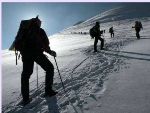
Detalj sa uspona

Nije jednostavno priti na 4500m. Prvi problemi su se pojavili kod jedne naše članice u navezi. Bodrimo je kako nebi cela naveza odustala. Pauze su sve češće. Mirno je bez vetra. Ipak su domaćini naručili vreme za naš uspon. Podno samog vrha prvi penjači su probili snežnu strehu i izašli na plato.