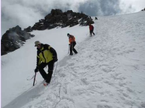
Detalj sa silaska