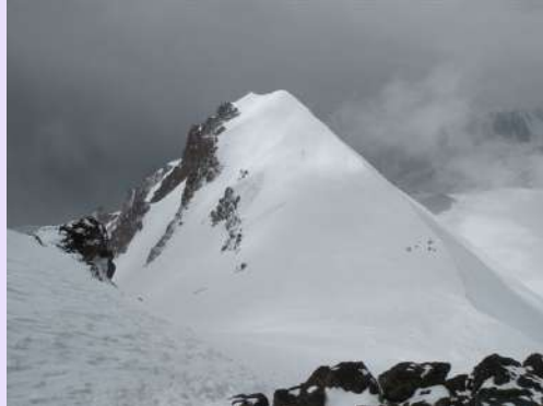
Pogled ka prevoju

Dođosmo i do kamenih kuloara. Sunce je otapalo sneg, a kamenje i ogromne stene su tutnjale njima. Tamo gde smo jutros prošli sada bi bilo jako rizično. Moramo preko glečera. U jednom trenutku smo stekli utisak da ni vodiči neznaju na koju će stranu. Sve su naveze na gomili. Na pojedinim mestima smo išli kroz pravi lavirint glečerskih pukotina. Pečurke sa ledenom drškom i kamenom kapom nas podsećaju na Đavolju varoš.