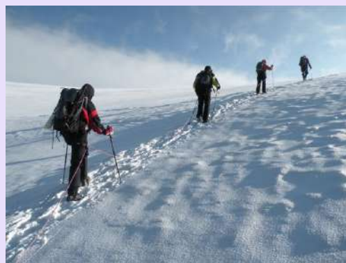
Detalj sa uspona

Nije jednostavno priti na 4500m. Prvi problemi su se pojavili kod jedne naše članice u navezi. Bodrimo je kako nebi cela naveza odustala. Pauze su sve češće. Mirno je bez vetra. Ipak su domaćini naručili vreme za naš uspon. Podno samog vrha prvi penjači su probili snežnu strehu i izašli na plato.