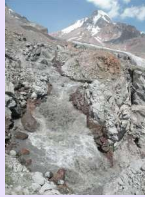
Nabujala glecerska reka

Pred nama je ogroman nabujali potok. Voda iz glečera se svake godine pojavljuje na različitim mestima. Zar je baš ove godine trebala da se pojavi tako nisko. Slučajno ili možda namerno nalazio se jedan drugi gorštak sa svojim mulama koji se ponudijo da nam stvari prebaci preko nabujale reke nesto malo vise ka glečeru.