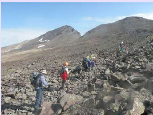
Detalj sa uspona

Dođosmo do prvog snežišta gde napravismo prvu pauzu. Izlaskom na greben pojavio se i kameniti put.