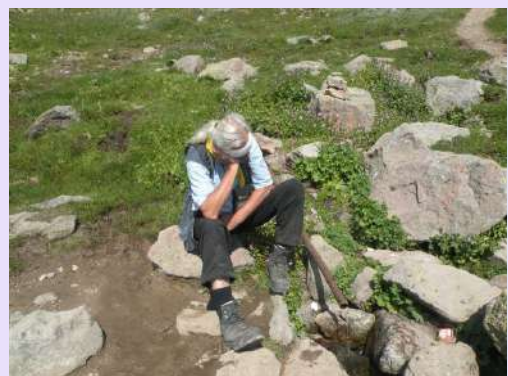
Dremka kraj izvora