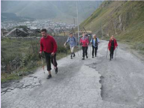
Krenuli smo iz Kazbegija

Usp on na Kazbek (5033m) smo započeli iz istoimenog mesta sa visine od 1800m. Nakon dugog putovanja jedva smo čekali kada će doći dan da malo protegnemo noge. Po preporuci domaćina iznajmili smo profesionalnog vodiča kako nebi rizikovali na usponu. Cena nam se nije svidela, ali je verovatnoća bila veća da se popnemo na najviši vrh Gruzije. Šturo informacije o usponu i neobeležene staze nas veoma brzo uveriše u ispravnu odluku. Krenuli smo u cik zore ka Kazbeku i meteo stanici iz Ruskog perioda koja je napuštena i skromno preuređena u planinarski dom. Dan prelep sunčan. Prvu pauzu napravismo na prevoju dokle smo možda mogli i džipovima. Za nama je ostala crkva Tsminda Sameba (Sv. Trojstva) na visini od 2179m. Planiramo obilazak crkve u povratku sa vrha. Naša manja grupa odlično napreduje ka Kazbeku gde su nam oči stalno uprte. Velike transportne rančeve, do glečera, nose iznajmljene mule.