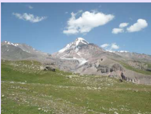
Kazbek sa prevoja

Nastavljamo stazom koja se polako spušta u dolinu reke Čeri koja se spaja sa nabujalom glečerskom vodom već nakon 500m od njenog izvora. Na putu se nalazi izvor pitke vode jedini na celom usponu do pl.doma. Računali smo da će mule izneti naše rančeve mnogo više nego gde ih zatekosmo.