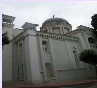
Crkva Sv. Jovana Prodromosa-Istanbul

Obišli smo crkvu Sv. Jovana Prodromosa, koja je verovatno podignuta oko 876g., a današnji izgled je dobila posle obnove 1896g.