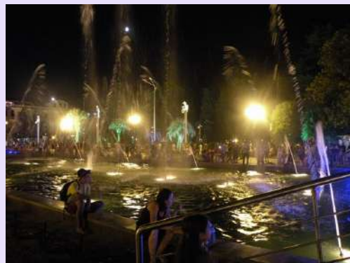
Raspevane fontane Batumija

U ovom izveštaju je data opšta slika našeg putovanja. Nema mnogo istorije, umetnosti, arheologije... Sati vođenja po lokalitetima i sve ispričane priče bi imale dimenzije knjige. Uz samo dve noćne vožnje smo bili na granici Gruzije. Put do te granice je bio dug ali na sreću Gruzija i Jermenija spadaju u teritorijalno male države što nam je omogućilo da vidimo većinu izuzetnih spomenika u obe zemlje. Pored upona na Kazbek i Aragac, bukvalno smo svaki dan imali organizovano razgledanje, osim poslednja dva-tri dana u letovalištu Kobuleti. Učesnici pohoda, bez obzira na naporno putovanje, bili su opušteni, tolerantni i lepo raspoloženi, što je retko za tako jednu heterogenu ekipu. Popeli smo se na planine koje smo planirali, obišli po programu spomenike, muzeje i lokalitete ove dve drevne zemlje. A zahvaljujući Ireni Andjelić bili smo smešteni po prvi put u atipične i zanimljive ambijente. Tzv. home stay smeštaj je bio izvan svih očekivanja, s obzirom na naš uvek skromni planinarski budžet. Na kraju moram spomenuti iskustvo i umešnost Lastinih vozača Dušana Babića i Srete Ružića koji su nas bezbedno vozili više od 7,600 km kroz vrleti i bespuća Gruzije i Jermenije.