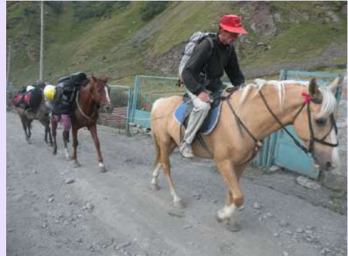
Transport opreme do glečera

Do prevoja je staza išla livadama i kroz šumoviti deo a dalje zelenim grebenom prekrivenim gruzijskim čajem i oleaderom različitih boja. Za nepuna tri sata smo na visini od 2900m, prevoju odakle je nestvaran pogled na glečer na planinarski dom i na belu kupu, naš krajnji cilj. Nemoguće je ne zastati na ovom prevoju.