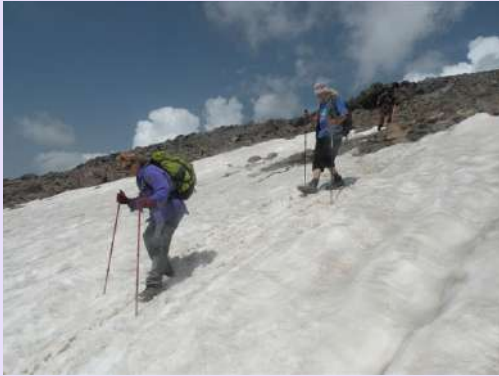
Silazak sa vrha

Vreme se na vrhu promenilo pa smo požurili ka našim automobilima. Vratili smo se do Arageca i uz hladno pivo sačekali naš autobus. Nekom drugom prilikom popećemo ostale vrhove Aragatca.