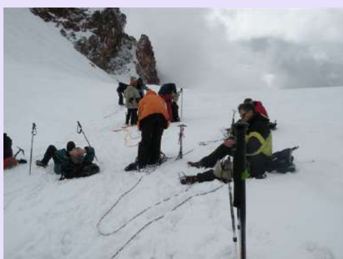
Pauza pred završni uspon

Svi se odmaraju i sakupljaju snagu za završni uspon od 150m. Pred nama je veoma strma padina zaleđena i prekrivena novim snegom. Naveza nam se smanjila za jednog člana. Konačno do izražaja dođe i cepin. Lagano se penjemo uz osiguranje partnera. Nakon savladane strmine nailazi ravniji deo. Vrh je pod maglom ali znamo da je tu negde. Konačno gomila ljudi na jedno mestu. Nalazimo se na 5033m najvišem vrhu Gruzije i jednom od zahtevnijih vrhova Kavkaza.