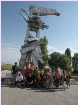
Spomenik jugoslovenskim pilotima iz 1988

Bili smo i u tvrđavi Garni (Goroneas). To je bilo poslednje boravište pontskog kralja Mitridata, koji se 40 godina borio sa moćnom rimskom imperijom. U kompleksu je identifikovana dvospratna kraljevska palata, terme, nekropola, crkva iz 897g. ... Najočuvaniji spomenik je hram u helenističkom stilu, najverovatnije posvećen Mitri, izgrađen od bazalta oko 115 g., a povod je bilo proglašenje Jermenije za rimsku provinciju. Svi ovi prethodno pomenuti spomenici su na listi svetske kulturne baštine UNESCO-a. Većina tvrđava i crkava u Jermeniji su podizane na temeljima fortifikacija i svetilišta drevnog naroda Urartu.