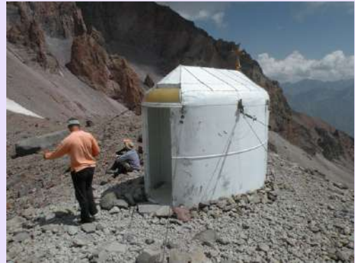
Kapela na 4000m

Nismo se žurili, želeli smo da što duže budemo na većoj visini. Niko od učesnika nije pokazivao simptome visinske bolesti. U povratku smo obišli crkvu koja je sigurno na najvišoj visini. Mala limena kapela, učvršćena sajlama se nalazi na preko 4000m.