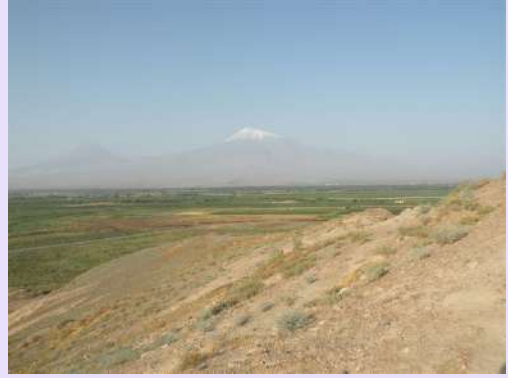
Ararat iz Jermenije

Jedan od najznačajnijih manastira Jermenije je Gegard (Koplje) iz 4 v., na listi je svetske kulturne baštine UNESCO-a. Osnovao ga je sam Sv. Grigorije, a ime je dobio po koplju kojim je Hristos proboden na raspeću. Jermeni veruju da je to koplje Apostol Tadej doneo u Jermeniju i danas se čuva u riznici Ećmiadzina. Ećmiadzin je četvrti po veličini grad u zemlji – nekadašnja prestonica, a danas najveći duhovni centar i sedište jermenskog patrijarha