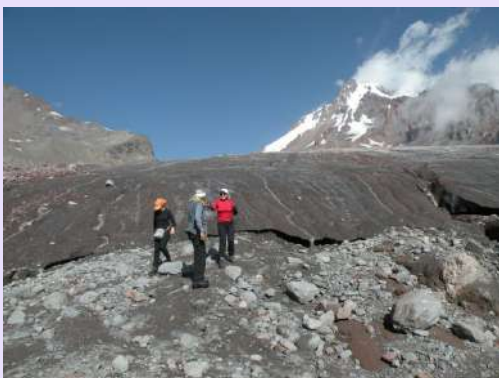
Silazak sa glečera

Posledice globalnog otoplavanja su očigledne. Dereze skinusmo tek na silasku sa glečera. Malo nam je laknulo. Jedva čekamo da dođemo u dom na tople i hladne napitke. Još jednu noć smo prespavali u domu. Verovatno smo prva grupa iz Srbije na Kazbeku. Sutradan smo krenuli istom stazom, ali sa manje tereta, od doma ka glečeru.