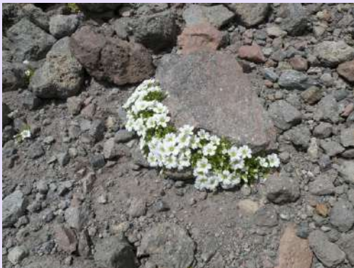
Cvece na vulkanskom kamenju

Rano smo se vratili sa aklimatizacije u dom. Trebalo je sačuvati snagu za sutrašnji dan. Popodne se vreme promenilo. Sneg, kiša, gmljavina. Kako li će biti sutra? Zar toliki put prevalismo zadžaba. Naveče se dogovaramo sa vodičima i domaćinima. Malo su nas ohrabрили jer, kako kazaše, naručili su dobro vreme samo za nas. Da im verujemo. Ustali smo po mraku i po planu krenuli. U koloni su Poljaci, Nemci, Ukrajinci i mi iz Srbije. Po mraku smo se provukli ispod kamenih kuloara. Zora nas je zatekla ispod prevoja na 4500m. Dalje nastavljamo u navezi.