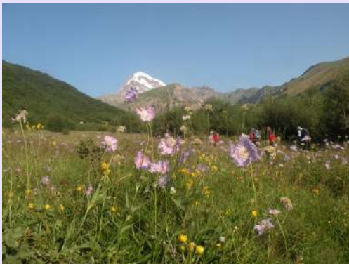
Pogled ka vrhu

Do prevoja je staza išla livadama i kroz šumoviti deo a dalje zelenim grebenom prekrivenim gruzijskim čajem i oleaderom različitih boja. Za nepuna tri sata smo na visini od 2900m, prevoju odakle je nestvaran pogled na glečer na planinarski dom i na belu kupu, naš krajnji cilj. Nemoguće je ne zastati na ovom prevoju.